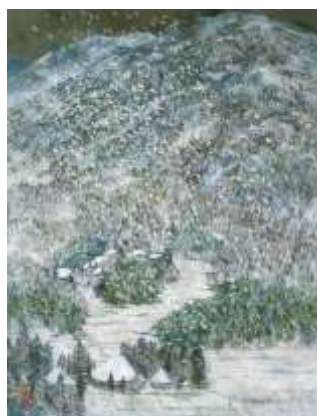
11・12月「雪の大原」由里本出